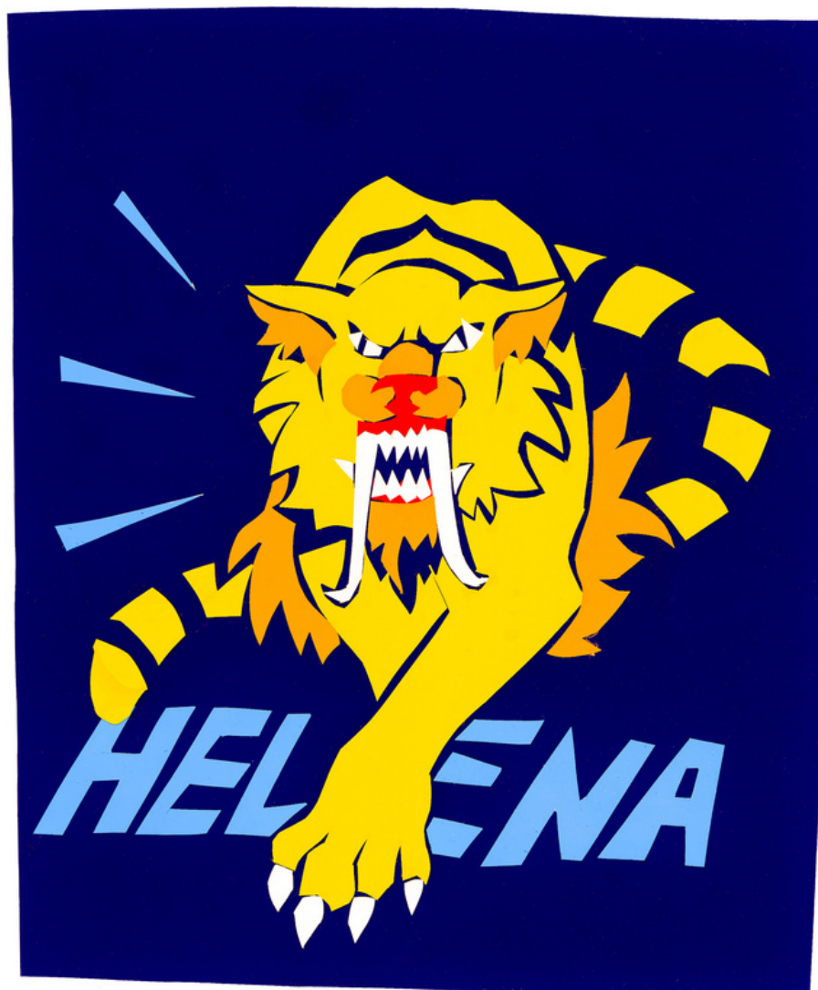
wlepka stworzona techniką wycinania i naklejania na siebie folii

Powstała w ten sposób naklejka nadaje się do przyklejenia w dowolnie wybranym miejscu. Możesz nakleić ją na swój zeszyt, drzwi do pokoju, lodówkę, grzbiet swojego laptopa, drzwiczki szafki, lub doniczkę. Taka naklejka jest też do pewnego stopnia odporna na działanie czynników atmosferycznych, więc może zostać też umieszczona na zewnątrz.